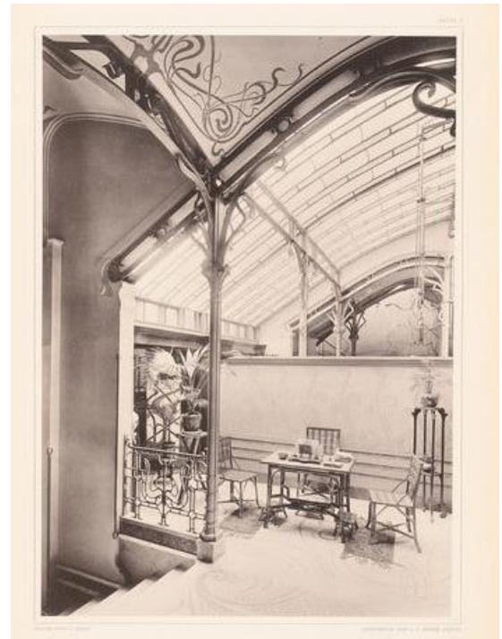
Interior da Casa Tassel

_____, Jugendstil, Modernismo, Secession, Estilo de Glasgow, estilo Liberty e estilo Floreal. A natureza foi a inspiração universal da Art Nouveau. Pode reconhecer a Art Nouveau pelos seus ornamentos florais, formas geométricas, _____ pelo uso de figuras simbólicas. Pode ver estas características na arquitetura, mobiliário, moda e arte.