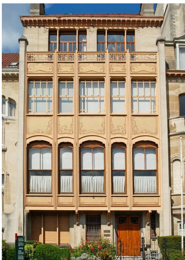
Casa van Eetvelde

Tarefa 4 Olha para as fotografias de dois edifícios construídos por Victor Horta: Casa van Eetvelde, e Casa & Atelier Horta. Em que semelhanças e diferenças reparas? Discute em pares. (5 minutos)