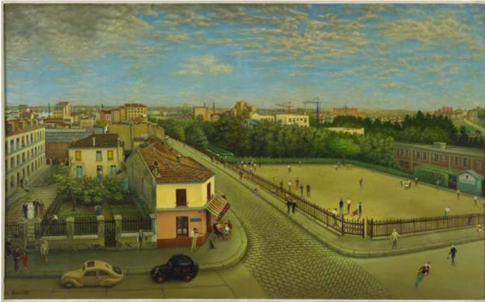
Pierre Arcambot, “Da minha janela, esquina das ruas Régault e Château-des-Rentiers”, 1955, óleo sobre tela