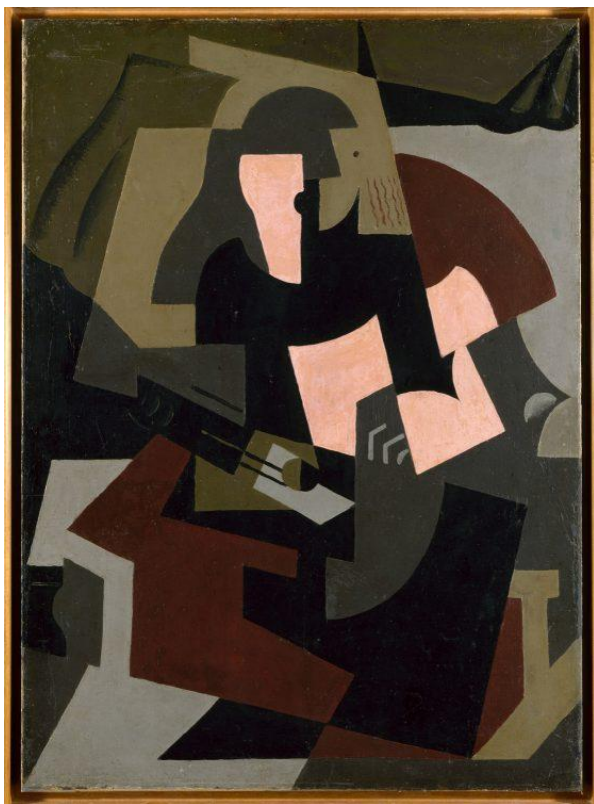
Maria Blanchard, “Mulher com guitarra”, 1917, óleo sobre tela