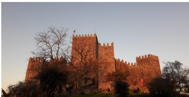
Figura 2 - O Castelo de Guimarães ao fim da tarde

5. A cidade de Guimarães é reconhecida como Património Cultural da Humanidade. [V] [F]