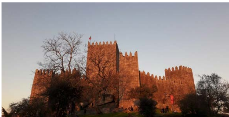
Εικόνα 2- Θέα του Κάστρου του Γκιμαράες το απόγευμα