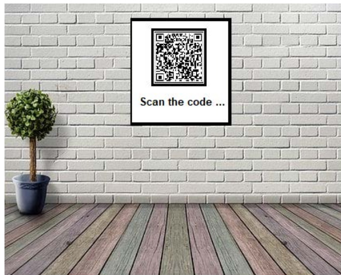
(código QR a ser digitalizado pelos visitantes)