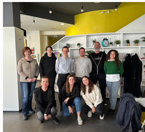
Fotografia da última reunião transnacional

Esta foi uma grande oportunidade para a parceria deste projeto se reunir pessoalmente uma última vez.