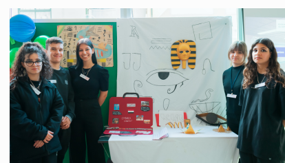
Fotografias dos e-workshops nacionais