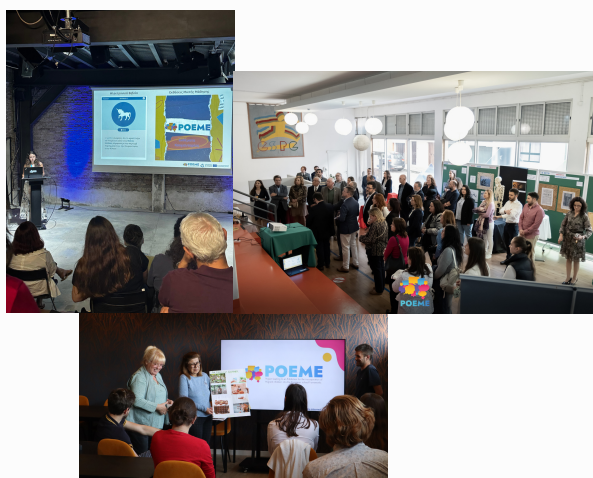
Eventos Multiplicadores levados a cabo no Chipre, Portugal e Bélgica